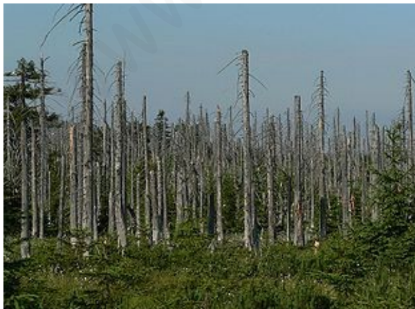
Consecuencias de la lluvia ácida en un bosque

La lluvia ácida se forma cuando la ..... en el aire se combina con algunos ..... emitidos por fábricas, centrales eléctricas y ..... que queman carbón o productos derivados del ..... Estos gases ..... con el vapor de agua de la atmósfera, y forman ácido sulfúrico y ..... nítricos. Finalmente, estas sustancias químicas caen a la tierra con las ....., formando la lluvia ácida.