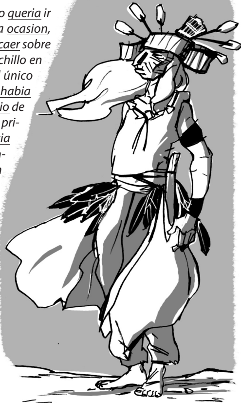
Jordi SIERRA I FABRA El último verano miwok, SM

El día en que Tortuga Veloz observó mis manos fue el último día que vimos a nuestro amigo como siempre le habíamos visto. Por eso guardo un recuerdo muy especial de él. Ya nada sería igual a partir de ese día, y los ciegos impulsos de la naturaleza humana desencadenarían la tempestad a la que nos vimos arrojados. Cuando Susan y yo regresábamos a casa, estuvimos comentando lo que no nos atrevimos a expresar en la cabaña: el aspecto de Tortuga Veloz. Como papá, él también, a veces, parecía envejecer súbitamente. Fuesen cuales fuesen los sueños de la noche anterior, tuvieron que ser muy especiales y de muy difícil interpretación, a pesar de sus mágicos poderes de hechicero miwok.