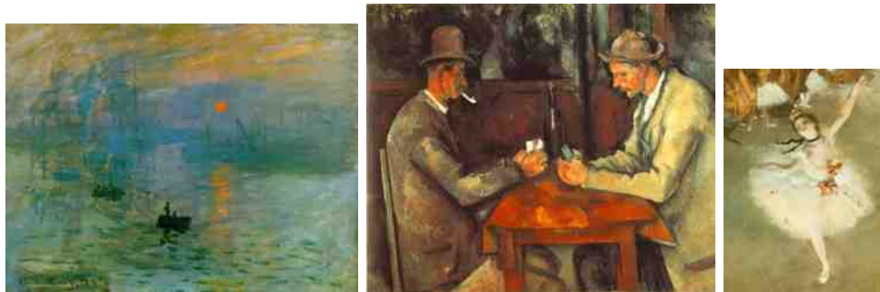
“Impresión: el sol naciente”

C) PINTURA: Durante este período se dieron diferentes movimientos pictóricos: -Impresionismo: Surgió en Francia. Su nombre se debe a un cuadro de Monet titulado “ Impresión: el sol naciente ”. Por primera vez, el arte se hizo exclusivamente experimental, el artista ya no le interesaba el contenido de la obra, sino la luz y la fugacidad del tiempo (por eso repetían un mismo dibujo a distintas horas). Además de Monet destaca, Manet, influido por Velázquez, (almuerzo sobre la Hierba); Renoir (Los jugadores de Naipes) y Degas (La Estrella).