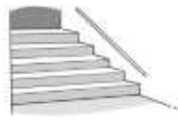
..... escalera .....