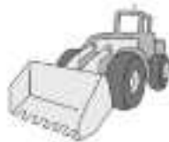
..... excavadora .....