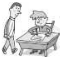
..... examen .....

3 Escribe el nombre de estos dibujos con x o s.