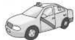
..... taxi .....

4 Completa el texto con x o s, según corresponda.