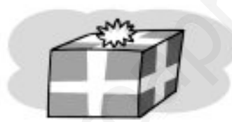
dos kilos y medio