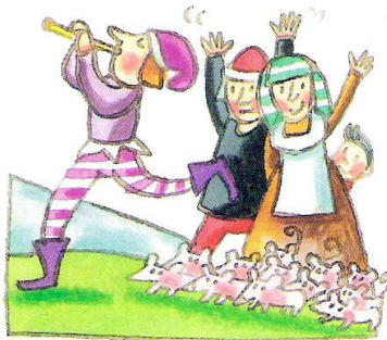
El flautista comenzó a tocar...