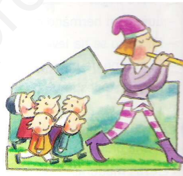
El flautista se marchó