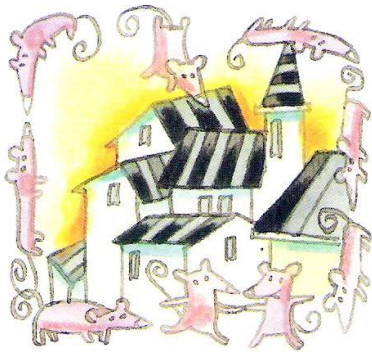
Había una vez un pueblo...