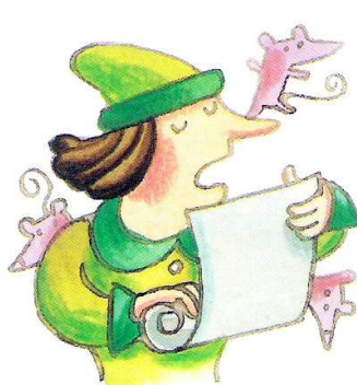
El pregonero leyó el bando...