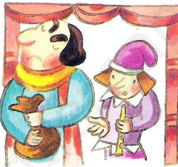
Pero, cuando el flautista