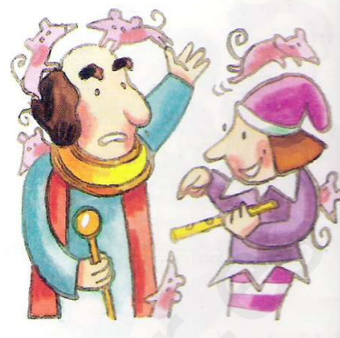
El flautista ofreció sus