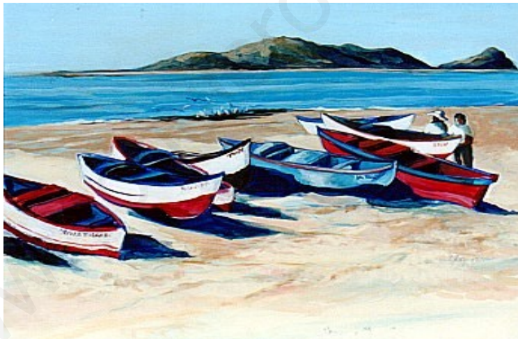
Barcos de pesca

La pesca consiste en sacar peces del agua para comérselos.