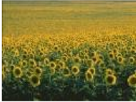
Campo de girasoles