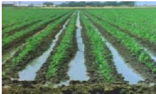
Cultivo de regadío

En el regadío se riega la tierra que se cultiva.