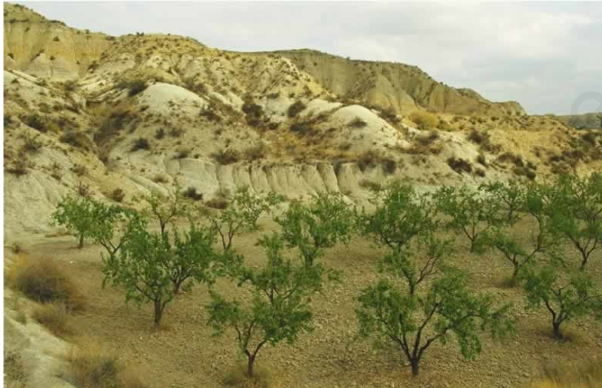
Árboles en secano

En el secano la tierra solo recibe el agua de lluvia.