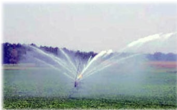
Spray irrigation in Michigan.