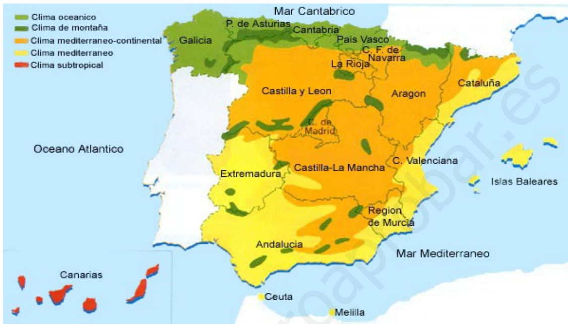
CLIMAS DE ESPAÑA