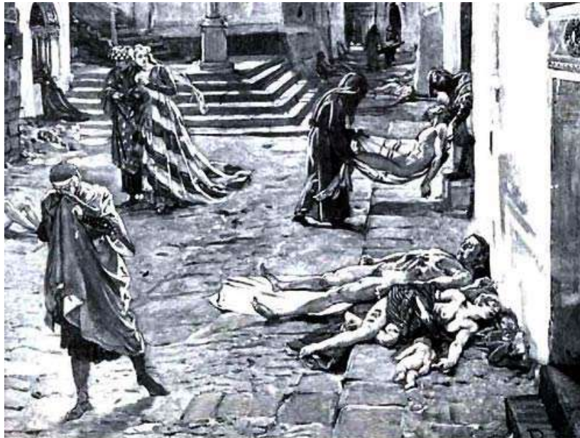
La Peste Negra en Italia en 1348, según una ilustración de Marcello