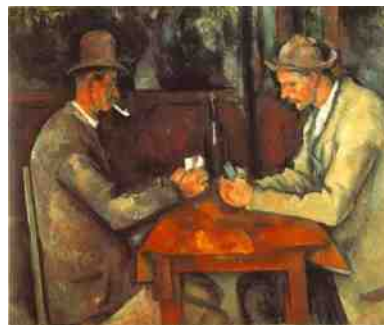
“Jugadores de naipes”