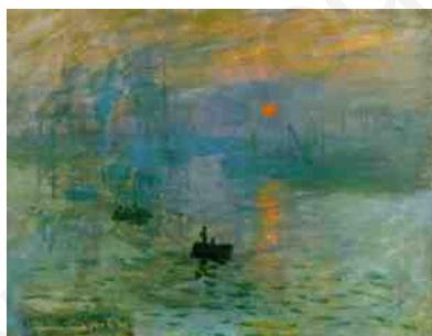
“Impresión: el sol naciente”

C) PINTURA: Durante este período se dieron diferentes movimientos pictóricos: -Impresionismo: Surgió en Francia. Su nombre se debe a un cuadro de Monet titulado “ Impresión: el sol naciente ”. Por primera vez, el arte se hizo exclusivamente experimental, el artista ya no le interesaba el contenido de la obra, sino la luz y la fugacidad del tiempo (por eso repetían un mismo dibujo a distintas horas). Además de Monet destaca, Manet, influido por Velázquez, (almuerzo sobre la Hierba); Renoir (Los jugadores de Naipes) y Degas (La Estrella).