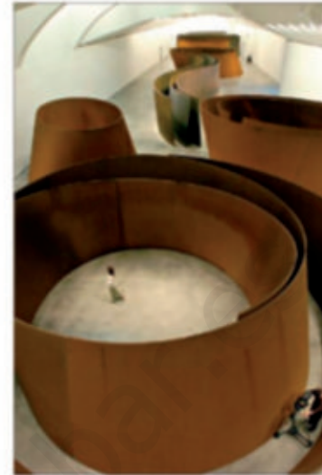
Exposición «La materia del tiempo».

Pero también hay hierro en los alimentos; es un nutriente de suma importancia para los seres humanos. La falta de hierro puede producir anemia.