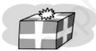
dos kilos y medio