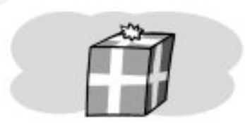
un kilo y cuarto