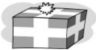
cuatro kilos y cuarto