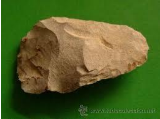
PIEDRA TALLADA DEL PALEOLÍTICO NEOLÍTICO