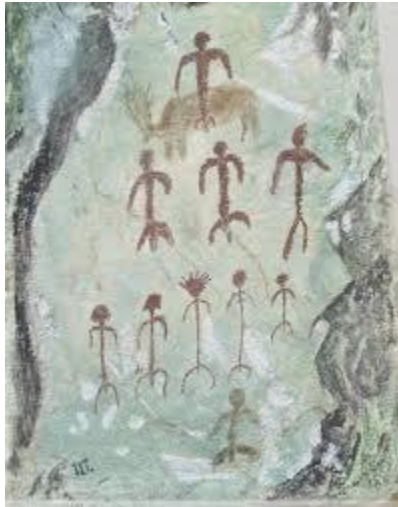
PINTURAS ESQUEMATIZADAS (NEOLÍTICO)