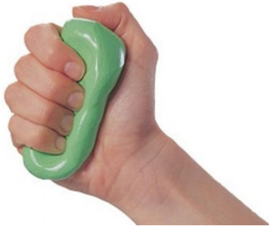
Una fuerza puede provocar un cambio en la forma de un cuerpo.

Una fuerza es la causa que produce un cambio en la forma de un cuerpo o un cambio en su velocidad