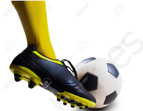
Una fuerza puede provocar un cambio en la velocidad de un cuerpo.